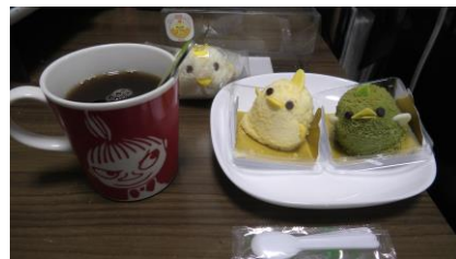
市販のレモンティーと 「ぴよりん」