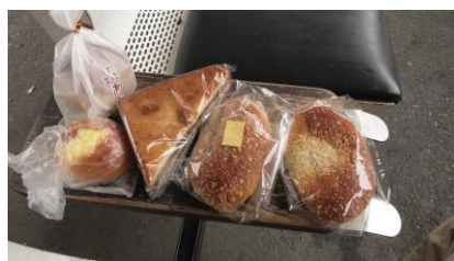
購入した、パン各種