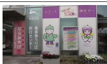
駅前の旅行センター