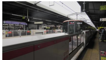
鶴橋駅-天王寺駅 323系 普通 天王寺・新今宮方面行き