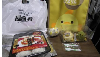
「ぴよりん」と 「餃子」を購入しました。