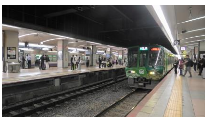
221系 「お茶の京都トレイン」