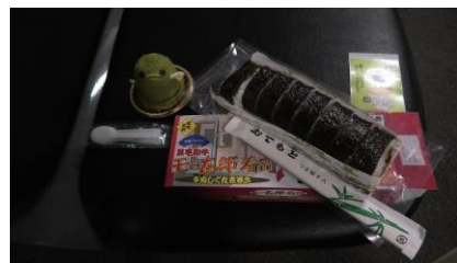
緑茶ぴよりんと 駅弁のあら竹のもー太郎寿司