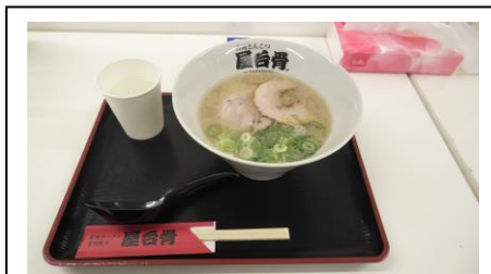
宮崎とんこつ屋台骨 ラーメン