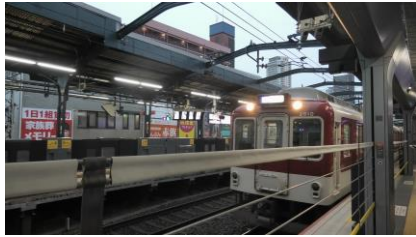
鶴橋駅から河内国分駅までは 榛原行き普通に乗車