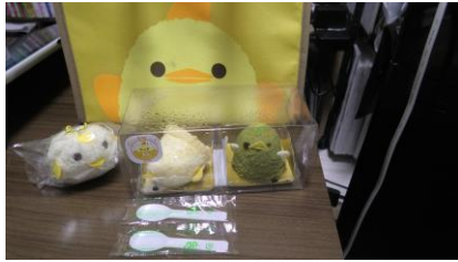
ぴよりんチャレンジ失敗・・・

ぴよりんチャレンジの結果は一体どうでしょうか。 箱を開けてみると・・・、「定番ぴよりん」は倒れていて、 「緑茶ぴよりん」は崩れそうになりながらも形は保っていますが、 片目が取れてしまっています😱