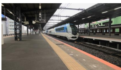
観光特急しまかぜ

誤乗を防ぐために、「10時54分発の特急しまかぜです、11時11分発の特急しまかぜをお待ちのお客様は、あとしばらくお待ちください。」と、アナウンスがなされていました。