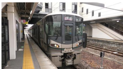
227系 1000 番台 和歌山線

高田駅から王寺駅までは和歌山線、王寺駅から天王寺駅までは大和路線、 天王寺駅からは阪和線で帰宅します。