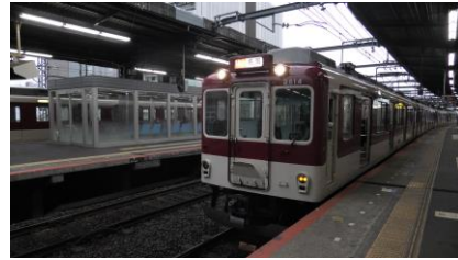
河内国分駅から 大和八木駅までは 名張行き区間急行に乗車