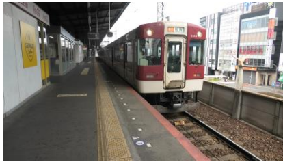
松阪行きの急行で 大和八木駅まで移動しました。

ぴよりんの整理券配布は9時半配布予定ということで、 予定時間の1時間前に近鉄百貨店橿原店前に到着しました。