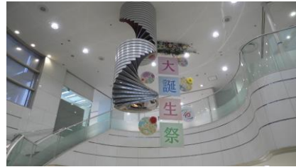
大誕生祭の装飾がされています