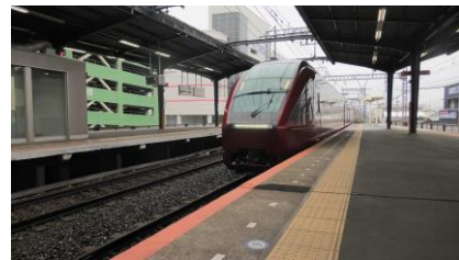
ひのとり 59 列車