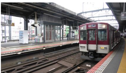
大和八木駅から 区間急行に乗車し、大和高田駅へ 移動します。