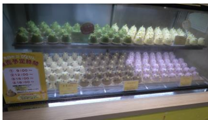
ぴよりん SHOP のショーケース (2026.4.26(日))

緑茶ぴよりんは、ぴよりん SHOP など 2026年4月17日（金）～4月26日（日）に販売された限定商品です。