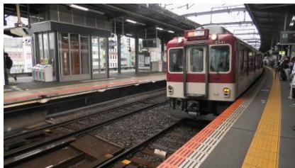
大和八木駅-鶴橋駅 2430系+2410系+1220系 区間急行 大阪上本町行き