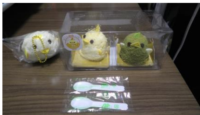
形を少し修正した「ぴよりん」

「ぴよりん」をいただく前に、少し形を修正しました。 市販のレモンティーと合わせていただきます。