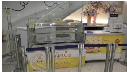
特設販売スペース