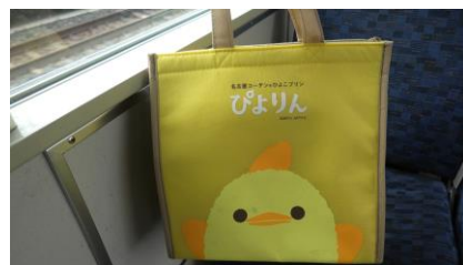
びよりんチャレンジ挑戦中