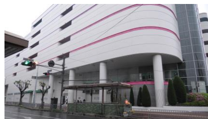
近鉄百貨店橿原店