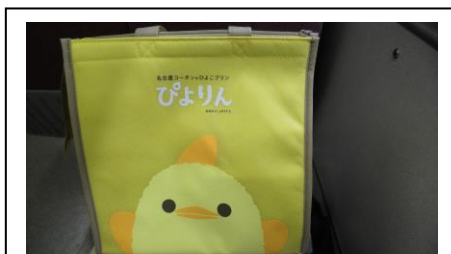
保冷バッグ (ぴよりん shop で 販売しています)