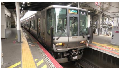
天王寺駅-鳳駅 223系 2500番台 区間快速 熊取行き