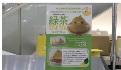
緑茶ぴよりんのポスター