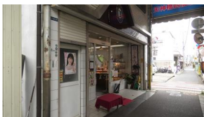
ウエダベーカリー

大和高田駅から少し歩いて、「ウエダベーカリー」に到着しました。 パンを購入します。