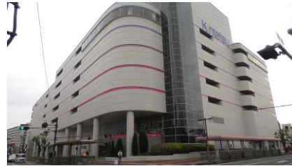
近鉄百貨店橿原店

しかし、予定時間の1時間前にもかかわらず、 整理券配布の予定数に達したため、 この日は泣く泣くあきらめることにしました。