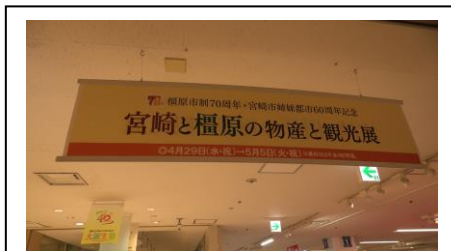
宮崎と榎原の物産と観光展

6階催事場では「宮崎と榎原の物産と観光展」が開催されているため、訪れてみようと思います。