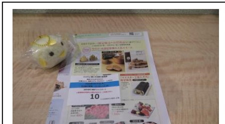
無事に整理券を入手しました (※マスコットは付いてきません)

本日は無事に整理券を入手することができました。 ぴよりの販売時間は13時からです。時間まで他の場所に移動します。