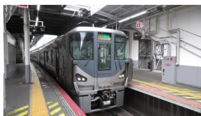
225系 5000 番台 区間快速 熊取行き